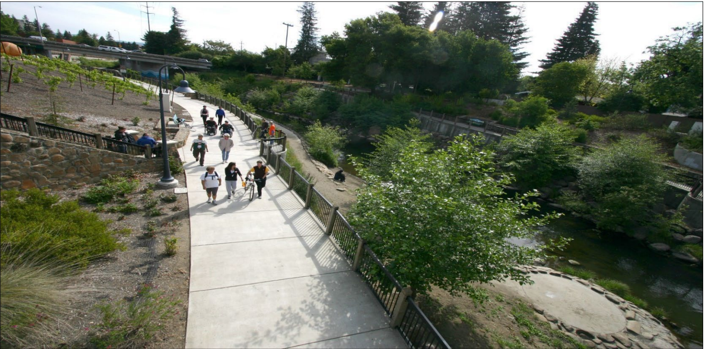
Vía verde del Arroyo Santa Rosa, proyecto del Programa de Subvenciones Equivalentes de 2001